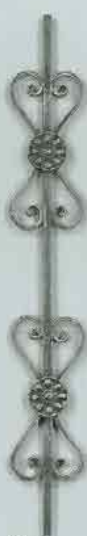
4329 950 x 115 (12)