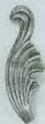
4151 H. 155 x 60