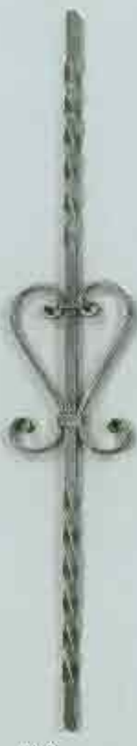
4334 950 x 140 (12)