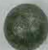
4139 Ø 100