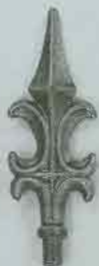
4101 H. 210 Ø 18