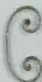
4254 200 x 100 □ 15 x 4