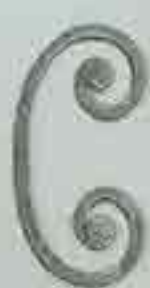
4256 200 x 100 □ 8