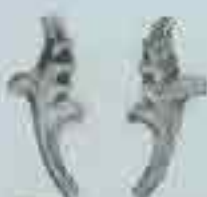
4020 70 x 32