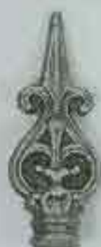
4106 H. 140 Ø 32 H. 125 Ø 25