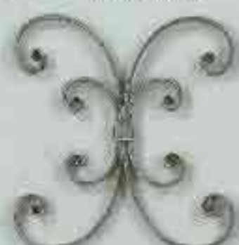
4258 250 x 250 □ 15 x 4