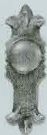
4051 165 x 55