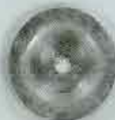
4059 Ø 76 Ø 92