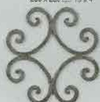
4263 250 x 250 □ 8