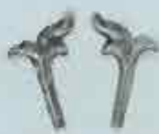
4022 60 x 44