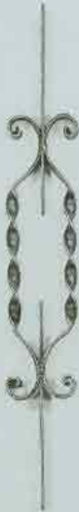
4320 720 x 115 □ 20 x 4