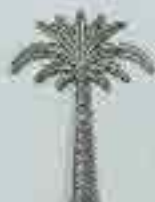
4302 175 x 115