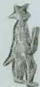
4066 130 x 60