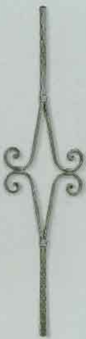
4355 950 x 200 □ 12