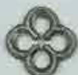
4305 Ø 115