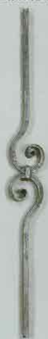
4362 950 x 95 □ 12