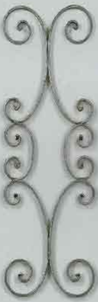
4286 720 x 250 □ 15 x 4