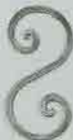
4252 200 x 100 □ 8