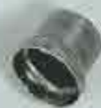
4065 Int. 22 Int. 32