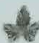
4010 50 x 55