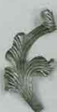
4273 / sx 200 x 150