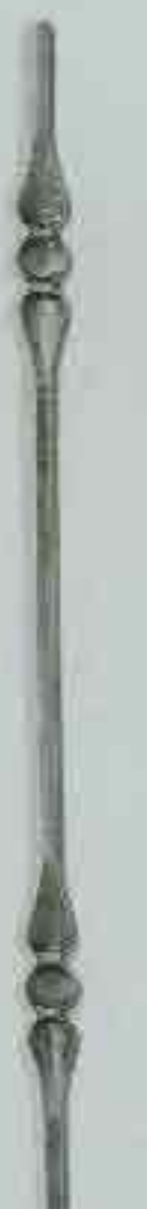
4364 950 Ø 12