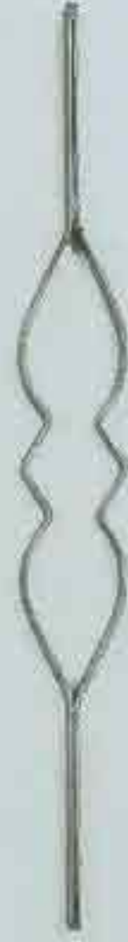
4322 720 x 95 □ 20 x 4