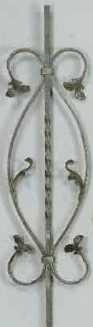
4357 950 x 210 □ 12