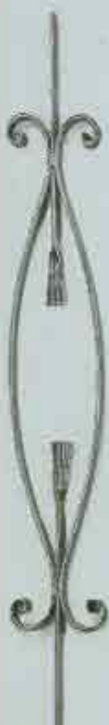
4317 720 x 105 □ 20 x 4