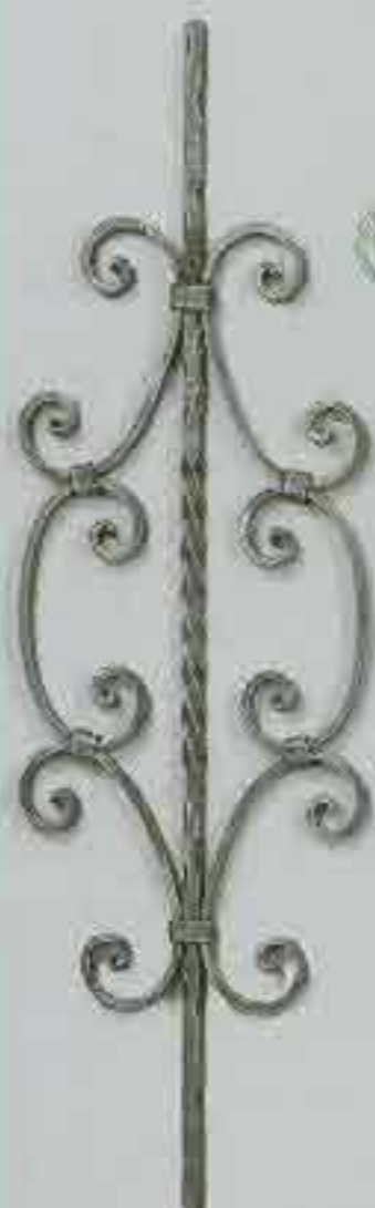
4351 950 x 250 □ 12