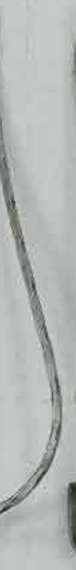
4377 950 Ø 12 x 5