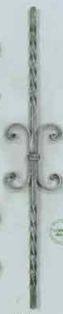
4338 950 x 150 (12)