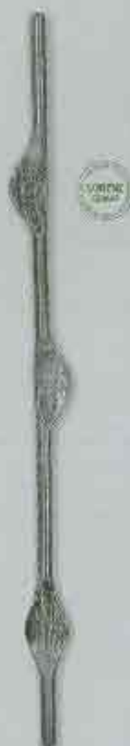
4368 950 Ø 15