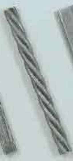
4226 Ø 28