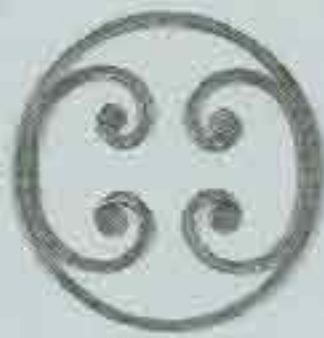
4311 Ø 250 □ 8