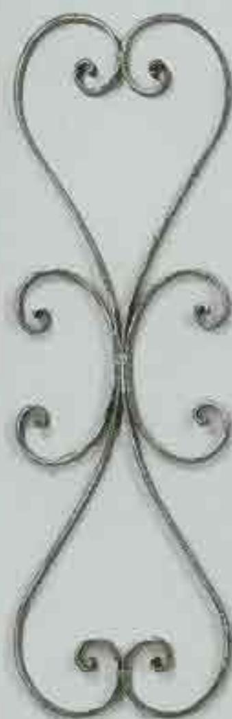
4284 720 x 250 □ 15 x 4