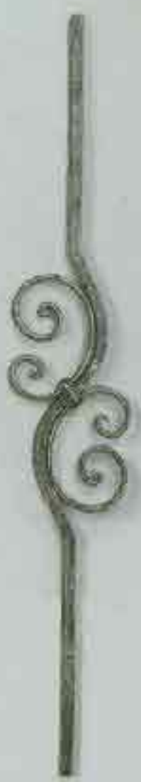
4356 950 x 140 □ 12