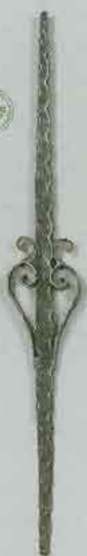
4352 950 x 120 □ 130 x 10