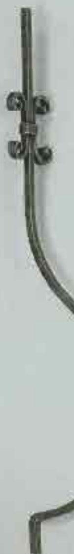
4371 950 Ø 12