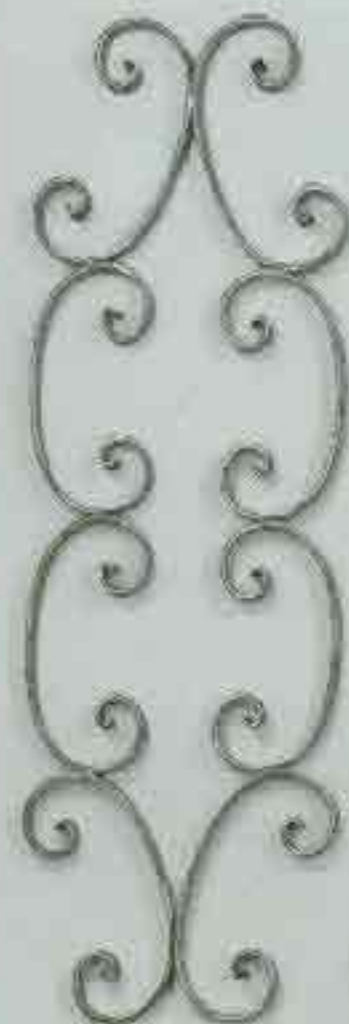
4265 720 x 250 □ 15 x 4