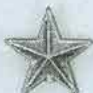
4164 Ø 76