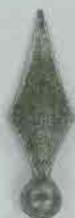
4104 H. 175 Ø 35