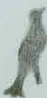
4068 100 x 85