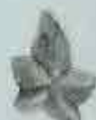
4019 62 x 48