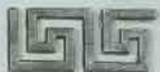
4308 250 x 100