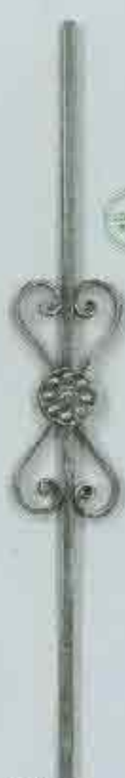
4330 950 x 115 (12)