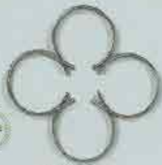
4310 Ø 250 □ 15 x 4