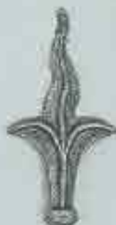
4138 H. 130 Ø 20