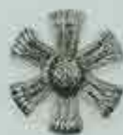
4073 Ø 62