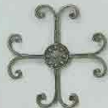
4261 250 x 250 □ 15 x 4