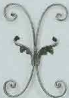
4313 300 x 200 □ 15 x 4