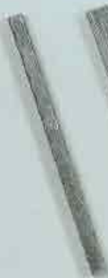
4224 c. 20 x 20