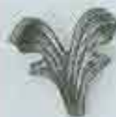
4157 H. 60 x 70