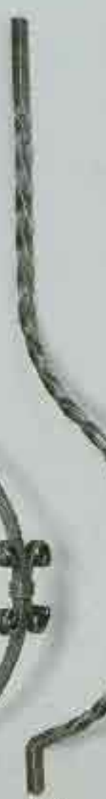
4372 950 Ø 12