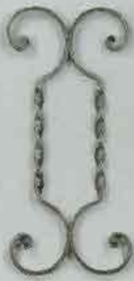
4277 400 x 200 □ 15 x 4