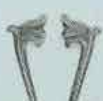
4024 65 x 30