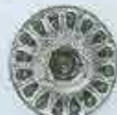
4167 Ø 68 Sp. II