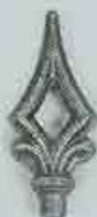
4131 H. 125 Ø 15