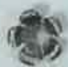
4030 Ø 44