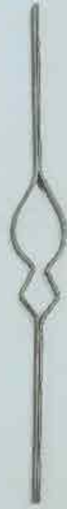
4323 720 x 95 □ 20 x 4