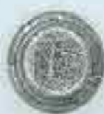
4166 Ø 60