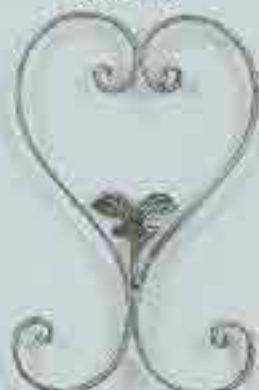
4315 300 x 200 □ 15 x 4