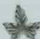
4009 50 x 55