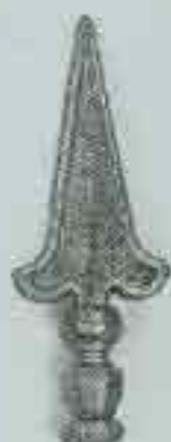
4132 H. 160 Ø 24