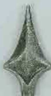
4112 H. 130 Ø 20