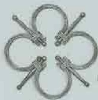
4309 Ø 250 □ 8