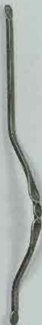
4363 950 Ø 12