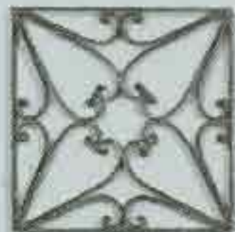
4314 250 x 250 □ 10 x 3