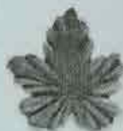
4012 95 x 90 110 x 105 130 x 135