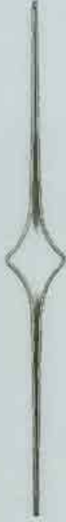
4321 720 x 95 □ 20 x 4