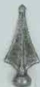
4137 H. 110 Ø 25