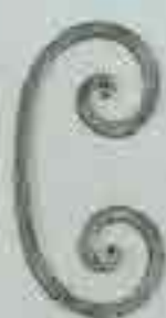
4255 200 x 100 □ 8