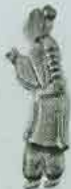
4067 130 x 50