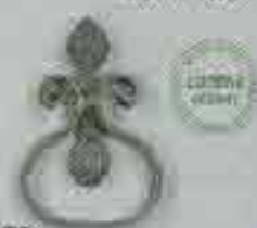
4278 140 x 100 □ 15 x 4