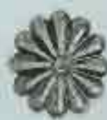
4028 Ø 58