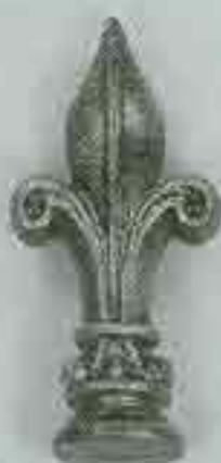
4103 H. 170 Ø 50