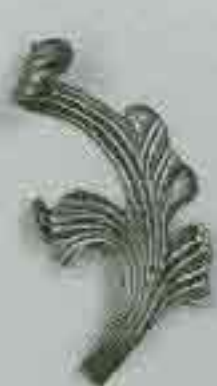
4274 / dx 200 x 150