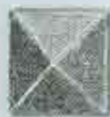
4163 70 x 60