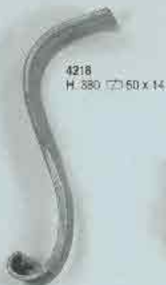
4218 H. 380 c. 50 x 14