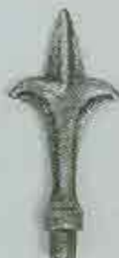
4110 H. 125 Ø 12 H. 155 Ø 16