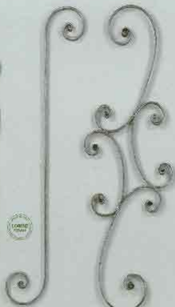
4266 720 x 100 □ 15 x 4