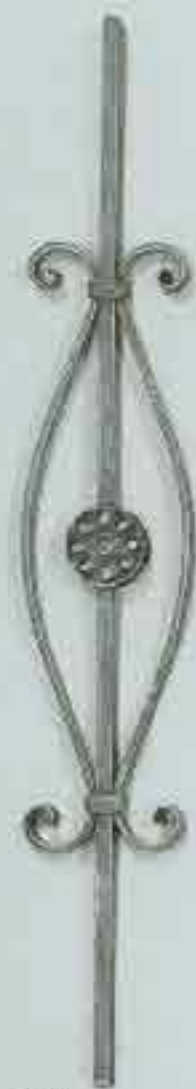
4325 950 x 135 (12)