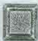
4165 450 x 50