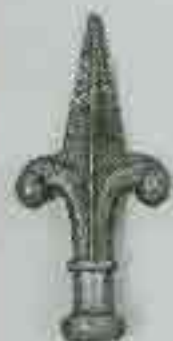
4133 H. 135 Ø 26