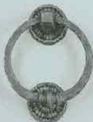
4203 Ø 200