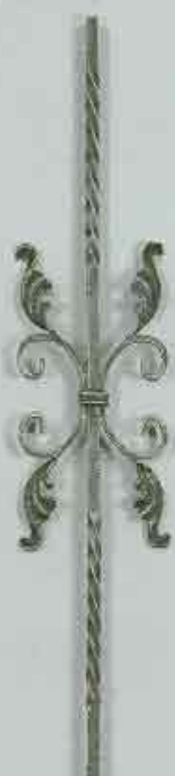
4360 950 x 170 □ 12