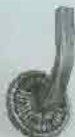
4204 Ø 90 x 140