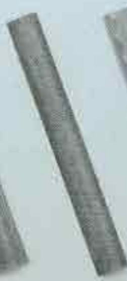
4228 Ø 40 x 14