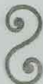
4253 200 x 100 □ 8