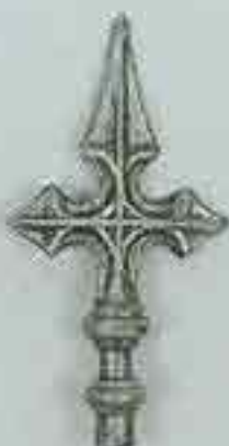
4113 H. 160 Ø 16