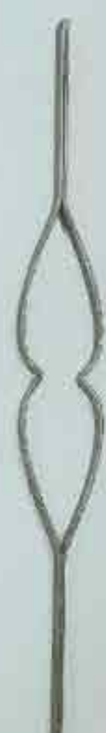
4324 720 x 95 □ 20 x 4