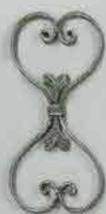
4270 300 x 150 □ 15 x 4