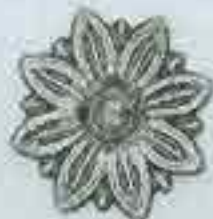
4160 Ø 90 Sp. II