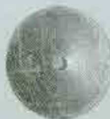
4071 Ø 48 - Ø 54 Ø 62 - Ø 70 Ø 80 - Ø 90 Ø 96 - Ø 120