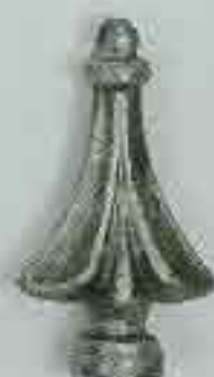
4115 H. 140 Ø 35