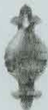
4052 128 x 54