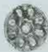
4162 Ø 82 Sp. 2