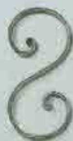
4251 200 x 100 □ 15 x 4