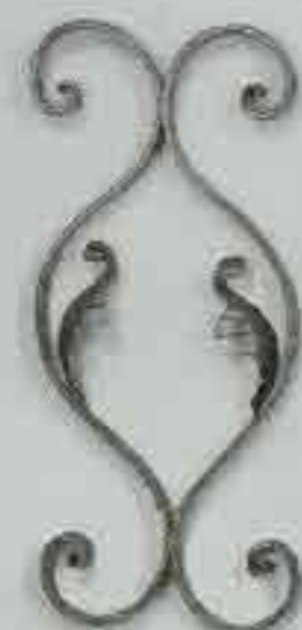
4275 400 x 200 □ 15 x 4