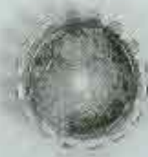
4064 Int. 42 Int. 60 Int. 80