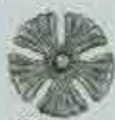
4303 Ø 115