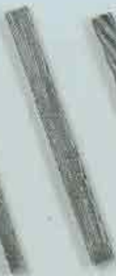
4225 c. 30 x 20