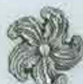
4168 Ø 78 Sp. 8