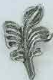
4153 H. 110 x 80