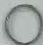
4279 O 200 □ 15 x 4