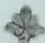
4018 52 x 62