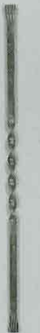
4367 950 Ø 15 x 4