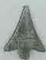
4149 H. 70 Ø 12