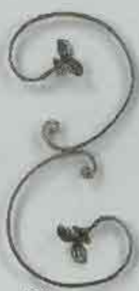
4276 400 x 200 □ 15 x 4