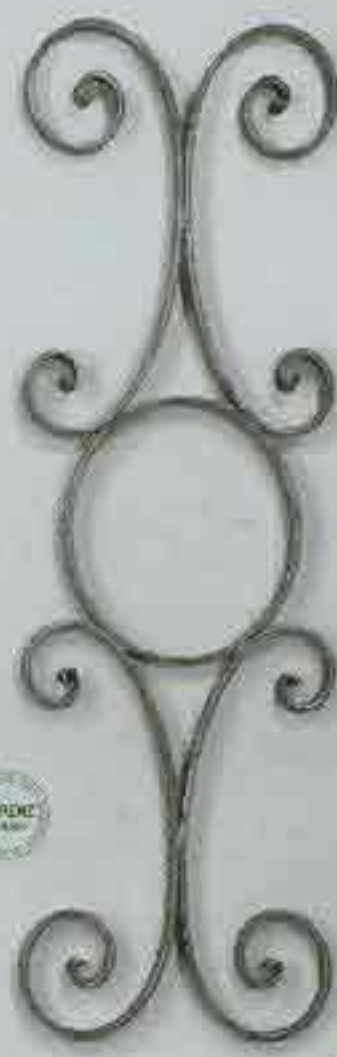
4288 720 x 250 □ 15 x 4