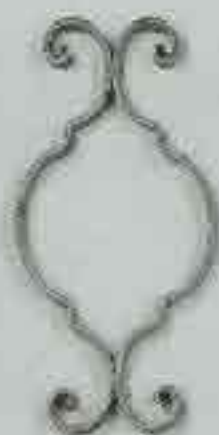
4271 300 x 150 □ 15 x 4