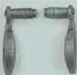
4209 - 120 c. 15 4210 - 145 c. 18