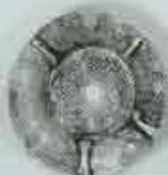
4061 Ø 85