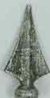
4114 H. 125 Ø 32