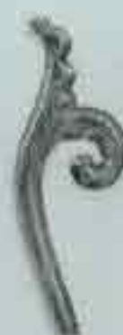
4006 135 x 60