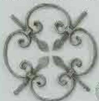
4257 250 x 250 □ 15 x 4