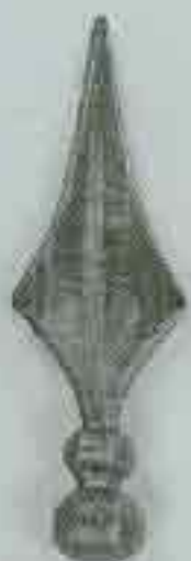
4102 H. 205 Ø 35 H. 175 Ø 29