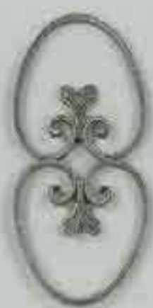
4272 300 x 150 □ 15 x 4