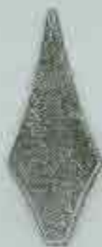
4107 H. 140 14x8