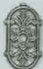
4307 185 x 100