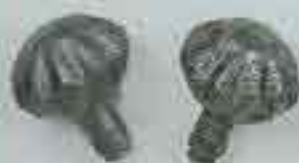
4207 Ø 55 c. 18 4208 Ø 85 c. 18