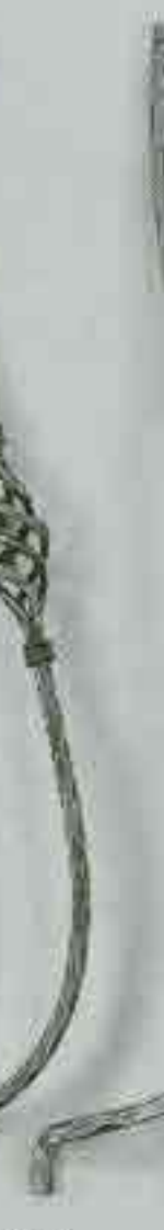
4376 950 Ø 12