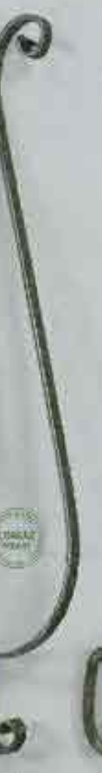
4378 950 Ø 12