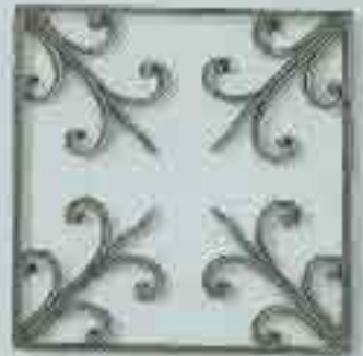
4316 250 x 250 □ 10 x 3