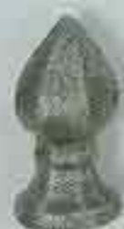
4116 H. 80 Ø 50