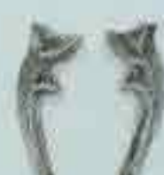
4026 77 x 22