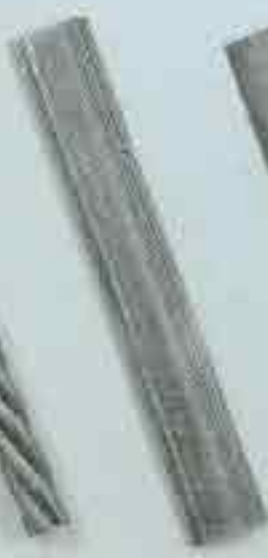
4227 c. 50 x 14