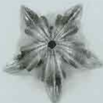
4053 Ø 126