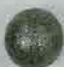
4140 Ø 60