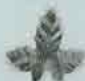
4011 56 x 62