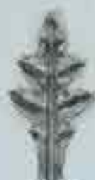
4013 60 x 50