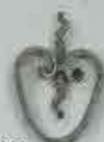
4280 140 x 100 □ 15 x 4