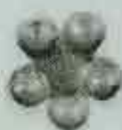
4074 Ø 60