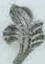
4159 H. 80 x 60