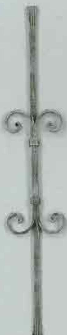
4366 950 x 950 Ø 12 15 x 4