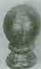
4117 H. 85 Ø 45