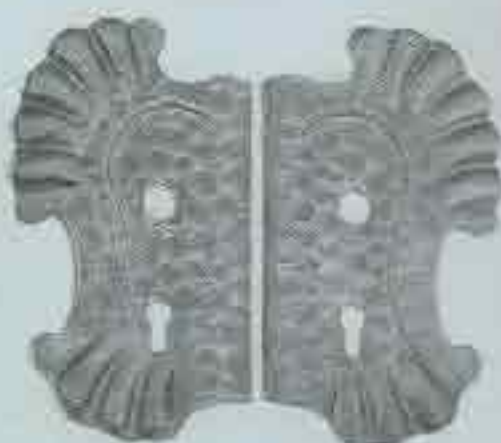
4205 / sx 275 x 160