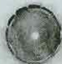
4056 Ø 60 - Ø 70 Ø 84 - Ø 100