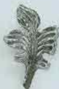
4154 H. 110 x 80