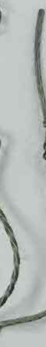
4375 950 Ø 12