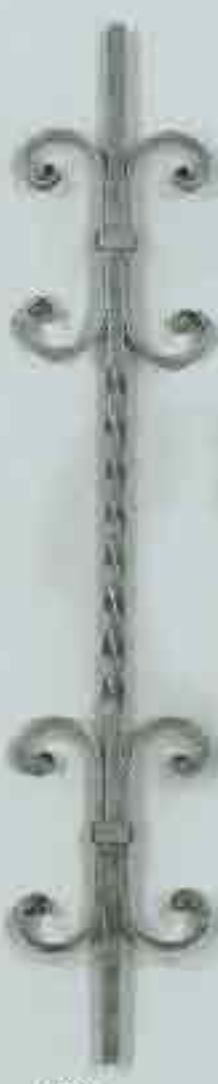
4337 950 x 160 (12)