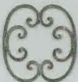
4262 250 x 250 □ 8