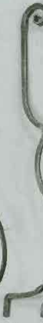
4374 950 Ø 12