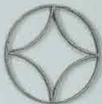
4312 Ø 250 □ 16 x 4