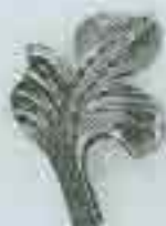
4158 H. 80 x 60