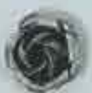
4029 Ø 44