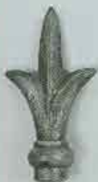
4111 H. 145 Ø 30