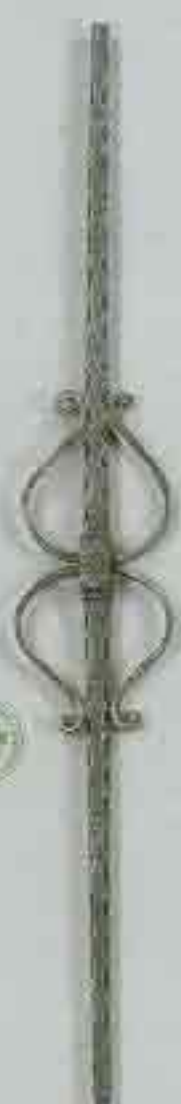
4358 950 x 125 □ 12