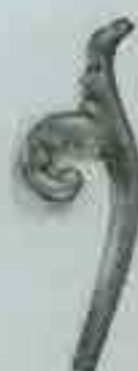
4007 135 x 50