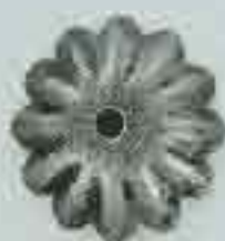
4057 Ø 54 Ø 71