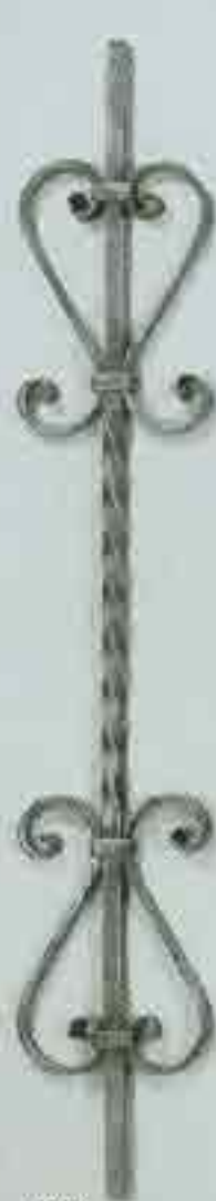
4333 950 x 140 (12)