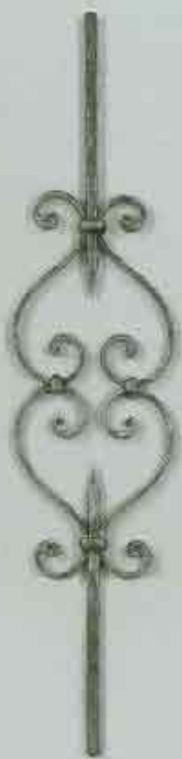
4354 950 x 130 □ 12