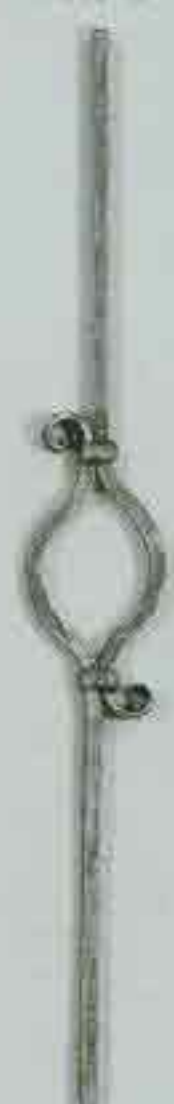
4361 950 x 110 □ 12