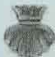
4016 65 x 65