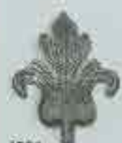
4301 150 x 120