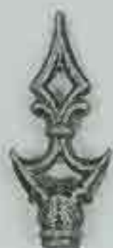
4128 H. 140 Ø 23