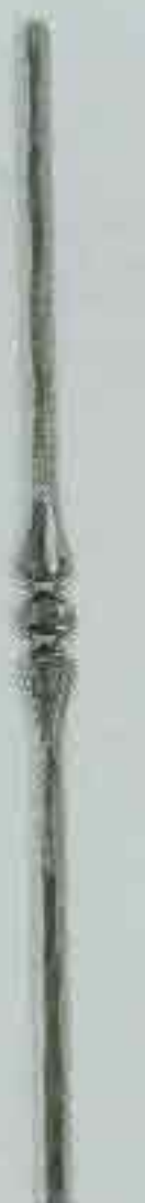
4365 950 Ø 12