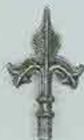
4136 H. 110 Ø 12