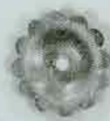
4062 Ø 78 Ø 94