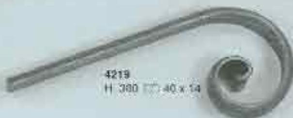
4219 H. 380 c. 40 x 14