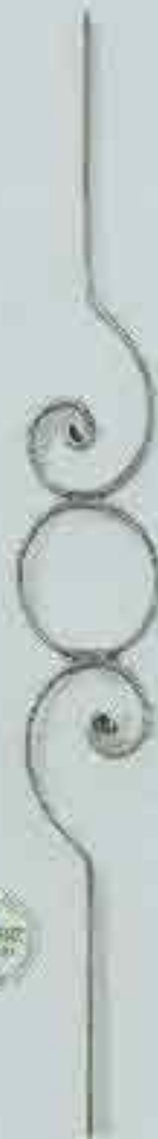
4319 720 x 100 □ 20 x 4