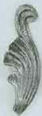
4152 H. 155 x 60