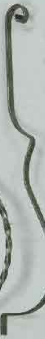
4373 950 Ø 12 x 5