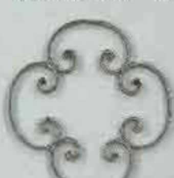
4259 250 x 250 □ 15 x 4