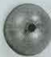
4060 Ø 82 Ø 80 Ø 100