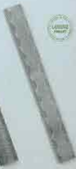
4229 c. 35 x 10