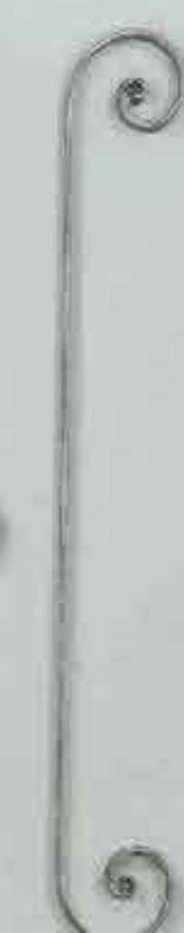
4267 720 x 250 □ 15 x 4