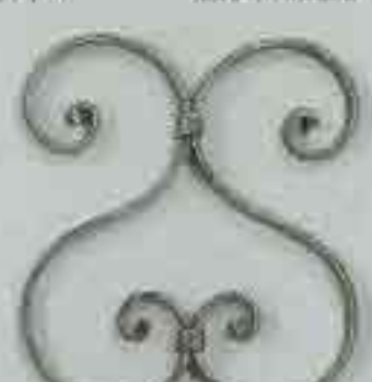
4260 250 x 250 □ 15 x 4