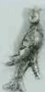
4069 100 x 85