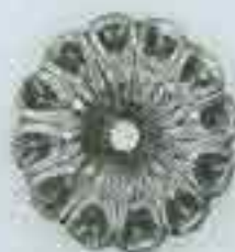
4161 Ø 90 Sp. 2