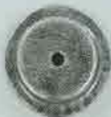
4058 Ø 80 Ø 98