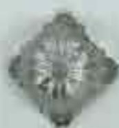
4063 Ø 84