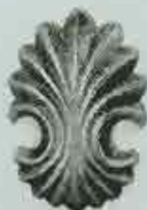
4072 105 x 75