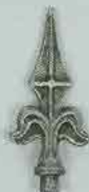
4108 H. 130 Ø 12 H. 155 Ø 16