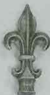
4105 H. 155 Ø 30 H. 120 Ø 25